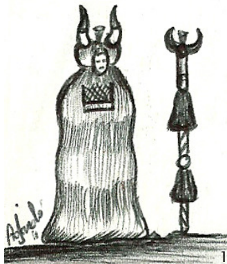
Image d'un Zangbeto

À côté des différents cultes de vodun il y a aussi les sociétés secrètes, comme les Engungun (les revenants, esprits des morts) ou les Zangbeto (les gardiens de la nuit).